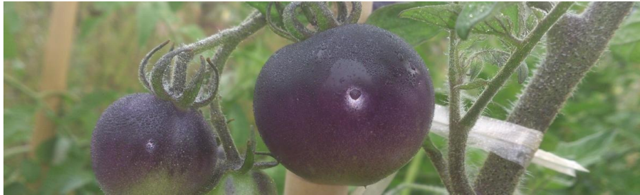
Solanum lycopersicum 'Osu blue'

Le Potager Extraordinaire, considéré comme l'un des jardins les plus riches en diversité potagère et en plantes extraordinaires, conserve plus de 2000 variétés de plantes en tout genre et en introduit chaque année de nouvelles.